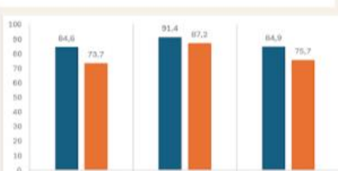
Condicionabilidade da Educação no Município de Uberaba-MG