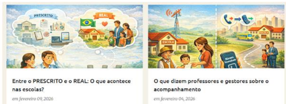
Figura 2 - Resultados da pesquisa