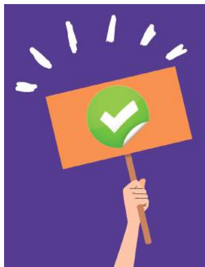
Quadro de avaliação das escolhas profissionais