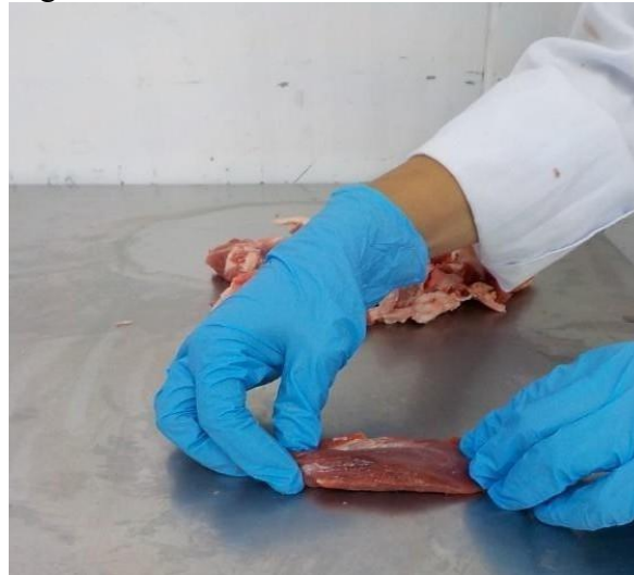
Figura 2- Coleta de retalhos de carne bovina.

A coleta de retalhos de carne bovina (Figura 2), foi realizada após a maturação sanitária das carcaças de no mínimo 24 horas na câmara fria com a temperatura máxima de 6,5 °C. Os retalhos foram retirados na sala de desossa, sob temperatura controlada \leq 9,5 °C, após o processo de toalete dos cortes cárneos que consiste na remoção de contaminantes físicos e químicos como, sebo, carimbos, pó de trilho, glândulas, cartilagens, ossos e pelos. Os retalhos são utilizados como matéria- prima para a produção de hambúrgueres e outros embutidos cárneos.