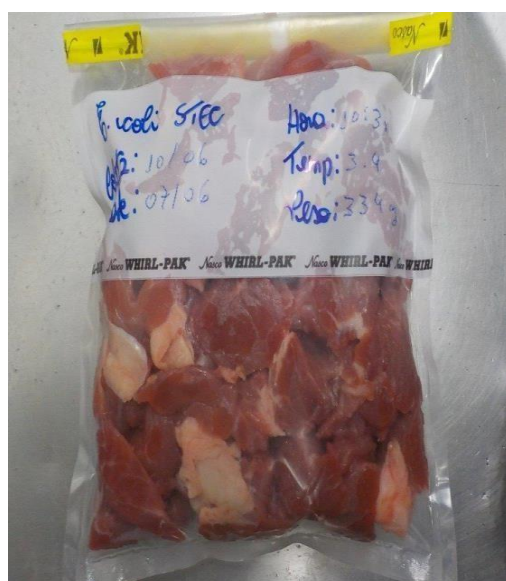
Figura 3- Identificação da amostra

Os pedaços foram coletados a partir de fatias finas retiradas da superfície da carne, com tamanho de aproximadamente 2,5 cm de largura, 8 cm de comprimento e 0,5 cm de espessura, com peso aproximado entre 5 g e 10 g e o peso da amostra final foi de no mínimo 325 g a 350 g, foram utilizadas para a coleta regua inox e balança para pesagem da amostra, devidamente esterilizada com álcool 70%, posteriormente foram acondicionadas em sacos de coleta estéril. Todo o procedimento foi realizado utilizando luvas descartáveis. (Figuras 2 a 5).