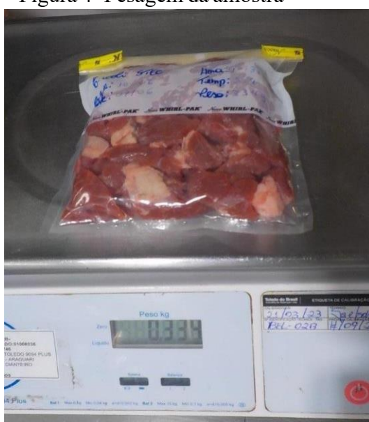
Figura 4- Pesagem da amostra