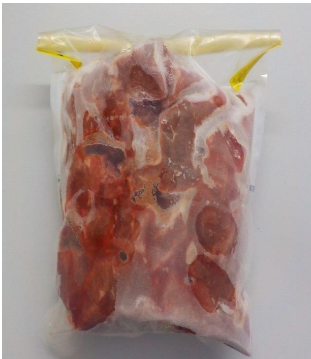
Figura 5- Amostra congelada a ser enviada ao laboratório para análise de E. coli STEC