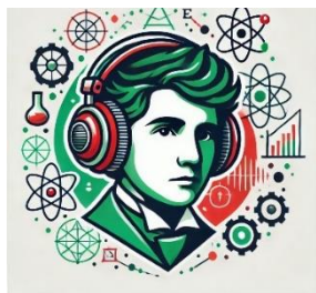
Figura 1- Logotipo do podcast